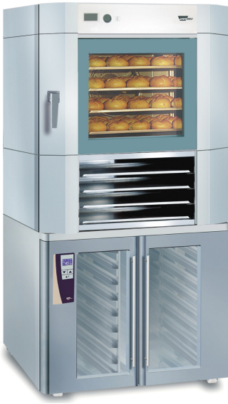
EUROMAT B4 EM