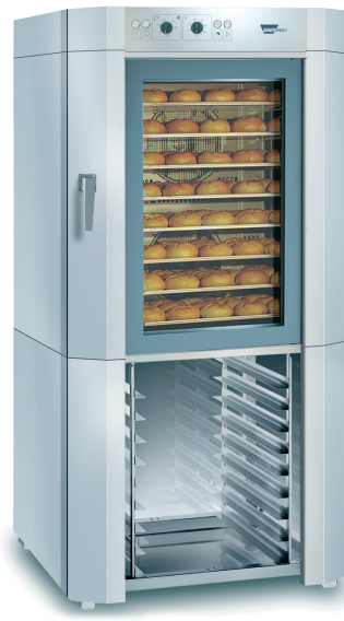
EUROMAT B8 EM